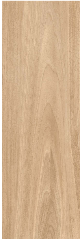
Tan 20x60/8"x24" Natural