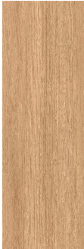
Miel 20x60/8"x24" Natural