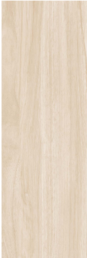
Haya 20x60/8"x24" Natural